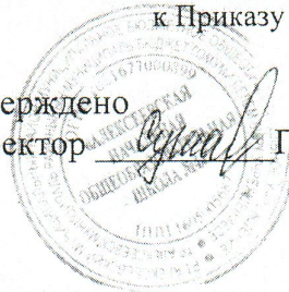
График приема пищи воспитанников на 2022-2023 учебный год